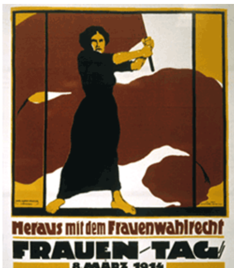
Plakat zum Frauenwahlrecht.

Seit knapp 91 Jahren haben Frauen in Deutschland das aktive und passive Wahlrecht. Dieses Recht, das uns heute so selbstverständlich erscheint, musste gegen viele Vorurteile von Männern und Frauen durchgesetzt werden. So wurde Frauen etwa verminderte Intelligenz unterstellt und auf Grund ihrer Gebärfähigkeit eine "natürliche" Bestimmung für den privaten, scheinbar politikfernen Bereich zugeschrieben.