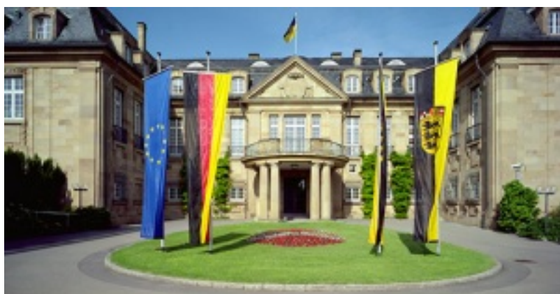
Villa Reizenstein

Baden-Württemberg ist aufgrund der verfassungsmäßigen Ordnung der Bundesrepublik Deutschland ein eigenständiges Land. Doch die Politik des Landes wird durch eine doppelte Einbindung stark geprägt: zum einen die Einbindung als Gliedstaat in die föderale Ordnung der Bundesrepublik, zum anderen durch die Einbindung in die Europäische Union. Diese Verbindungen setzen der „autonomen“ Politikgestaltung Baden-Württembergs einerseits Grenzen; andererseits eröffnen sie aber auch Handlungsmöglichkeiten.