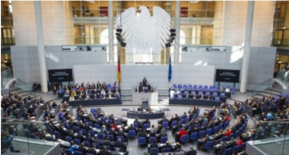
Blick ins Plenum des Bundestages.

Der Bundestag ist das Parlament der Bundesrepublik Deutschland. Es ist das einzige Bundesorgan, das unmittelbar vom Volk gewählt wird - und zwar durch die Bundestagswahlen, die in der Regel alle vier Jahre stattfinden.