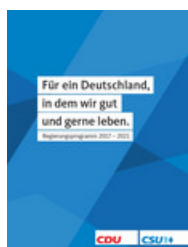
Wahlprogramm der Union

Mit welchen Themen die Union in den Wahlkampf zieht, steht hier .